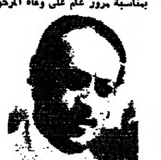
بناسية مرور على وفاة المرحوم

وسياسي ، الا ان المركز الاساسي هو المركز الامني . وقد بشرنا ضمن توجيهات الرئيس سركيس وتوجيهات